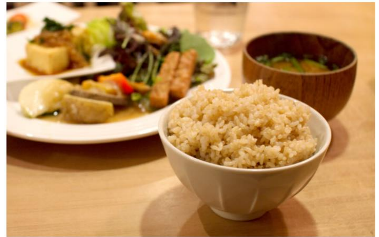
食べるオリーブオイル