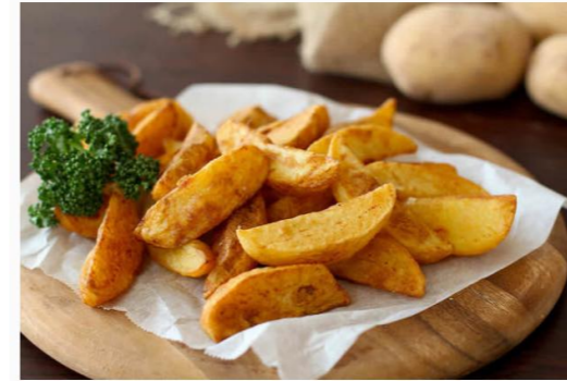
■3つポイントを押さえたところで、さっそく実践！「究極のフライドポテト」の作り方

それではさっそく、旬の新ジャガを使って作る「究極のフライドポテト」の作り方を紹介！ 外はカリカリ、中はホックホク。その絶妙な食感と広がるジャガイモの香りに、ひと口食べればさっとだれもが感動するはず。時間がたつとジャガイモの水分が出てしまうため、最高においしい瞬間を味わうためにも、揚げたら時間をあまりおさず早めに食べてほしい。